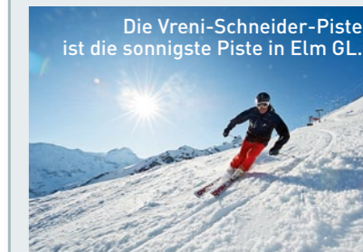
Die Vreni-Schneider-Piste ist die sonnigste Piste in Elm GL.

7 Wangs-Pizol SG Die Autobahn unter den Sonnenpisten am Pizol ist die Zanuz-Piste. Sie ist wunderbar breit und immer bestens präpariert. Obwohl sie zum Runterpreschen animiert, sollte man ein paar mal anhalten: Die Aussicht auf das St. Galler Rheintal bis zum Bodensee ist phantastisch. Tageskarte Erwachsene Fr. 54.–, Kinder Fr. 27.–, www.pizol.ch, 081 300 48 30